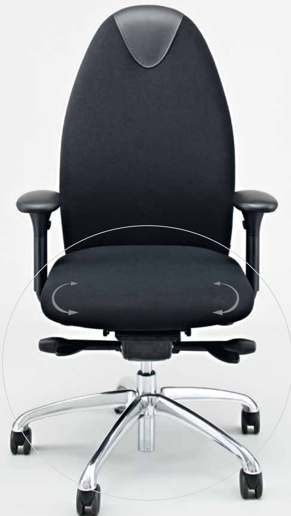
: tango TG 2451, Polster B 672 Aschau